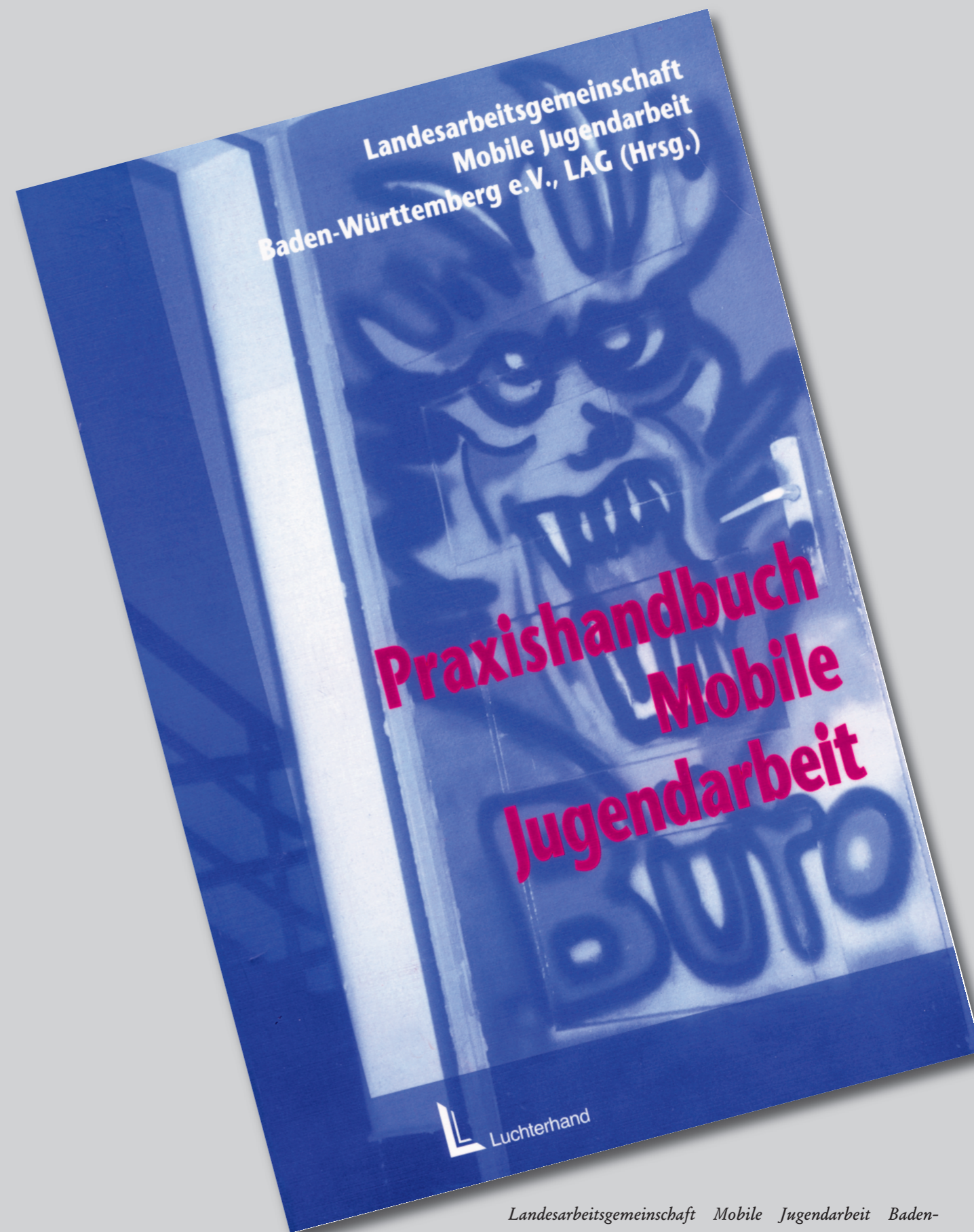
Landesarbeitsgemeinschaft Mobile Jugendarbeit Baden-Württemberg e.V. (Hg.): Praxishandbuch Mobile Jugendarbeit. Neuwied/Kriftel/Berlin (Luchterhand) 1997.

Die gefährliche Straße. Jugendkonflikte und Stadtteilarbeit. Bielefeld 1987.